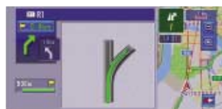
Ampliación automática de cruces