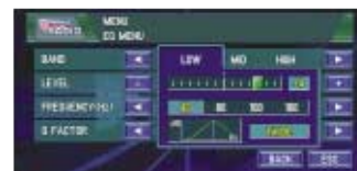
Mejorado control del sonido