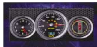
Dinámica del vehículo

Olvide los indicadores del salpicadero y supervise la velocidad, la dirección y la aceleración del coche, entre otros parámetros, gracias a la exactitud de cálculo del GPS. Disuada a los posibles ladrones con el subdisplay extraíble, para conseguir una seguridad adicional. Liberar su mente es lo que importa, incluso cuando no esté conduciendo.