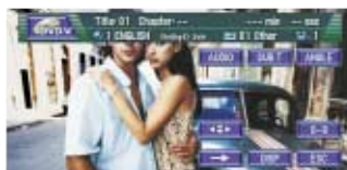
Control completo del DVD-Vídeo

* EN / DE / FR / IT / ES / NL / SV / DA / NO / PT Menús de AV en inglés