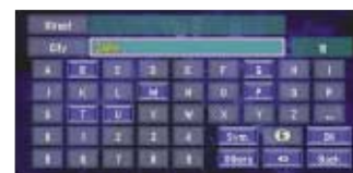
Interfaz de búsqueda fácil con entrada predictiva de texto