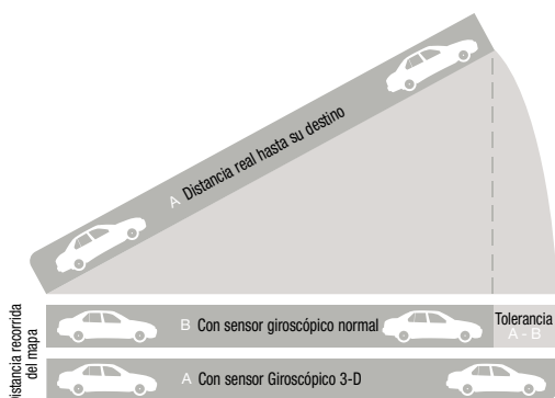
Sensor Giroscópico 3-D para identificar cálculos de navegación precisos