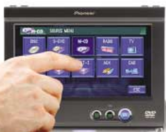
Control de fuentes integrado en la pantalla