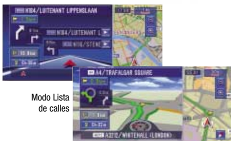
Modo Lista de calles

¿Se ha pasado una desviación? El AVIC-X1R recalcula automáticamente las rutas alternativas para devolverle al itinerario correcto.