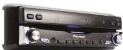
Subdisplay de 10 caracteres